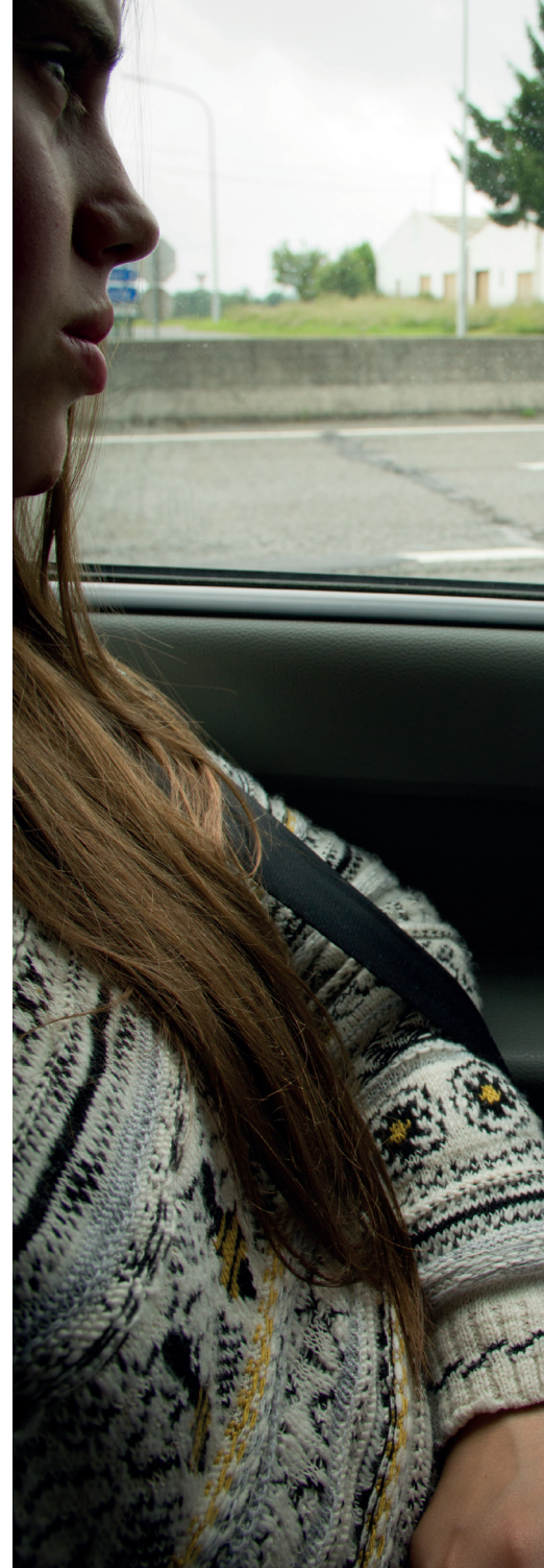
De achttiende verjaardag kondigt zich beloftevol aan op verschillende levensdomeinen: familie, opleiding en werk en de volwassenenhulpverlening.'