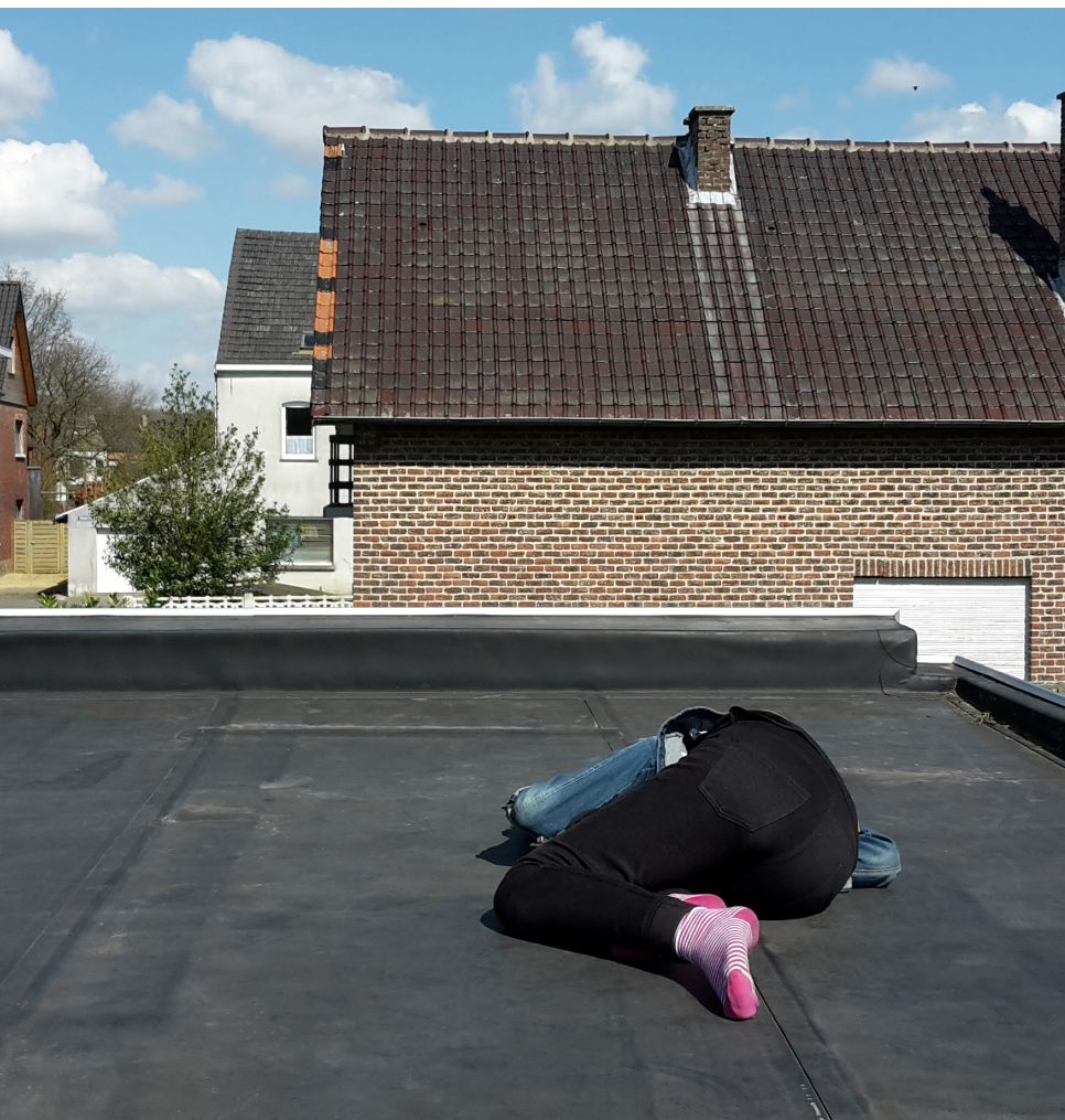
Een belangrijk uitgangspunt is dat zelfstandig wonen kan, maar niet noodzakelijk hoeft. De jongere kan er ook voor kiezen om terug naar huis te gaan, of om in te wonen bij een vriend(in), zus, broer of ander familielid.

Het Steunpunt stelde vast dat de overgang naar een zelfstandig leven en volwassenheid inderdaad erg moeizaam verloopt bij jongeren die een voorziening voor bijzondere jeugdzorg verlaten: 'Ze staan er meestal alleen voor en worden geconfronteerd met uitdagingen rond bijvoorbeeld huisvesting, werk en inkomen waartegen ze niet opgewassen zijn en waarop ook de maatschappij hen geen adequaat antwoord biedt. Wanneer jongeren een voorziening voor bijzondere jeugdzorg verlaten, staan velen onder hen er alleen voor. Dit is vaak een onbedoeld neveneffect van hun plaatsing, die gepaard gaat met breuken in hun familiaal en sociaal netwerk, hun schoolloopbaan en hun parcours in de jeugdhulpverlening. De achttiende verjaardag kondigt zich beloftevol aan, maar blijkt in werkelijkheid een opeenvolging van beproevingen op verschillende levensdomeinen: familiaal en sociaal netwerk, huisvesting, inkomen,